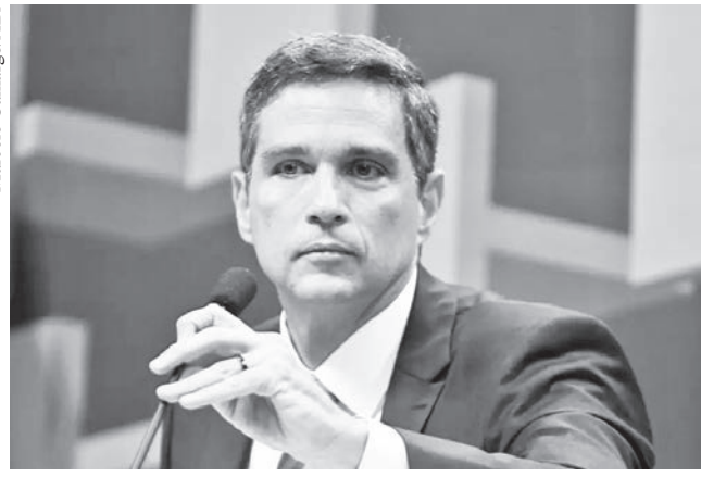
Roberto Campos Neto, presidente do Banco Central.