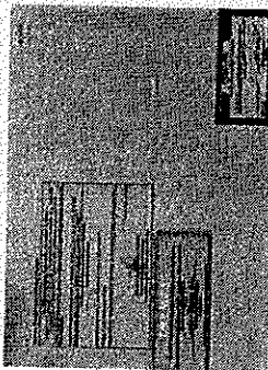
Diploma verso.jpeg 201K